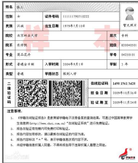
教育部学籍在线验证报告

5. 天津户籍未取得毕业证（2021 年入学前可取得）的高等教育自学考试本科生，须提供（1）自考生准考证；（2）户口本首页、索引页以及个人单页（集体户口仅提供首页及个人单页）。